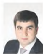
Председатель фракции ЛДПР в Законодательном Собрании

экологическим нормам не менее ЕВРО-4, находящихся на балансе лизингодателя и переданных в лизинг на срок не менее 1 года, с мощностью двигателя свыше 150 лошадиных сил, – отмечает Председатель фракции ЛДПР в Законодательном Собрании